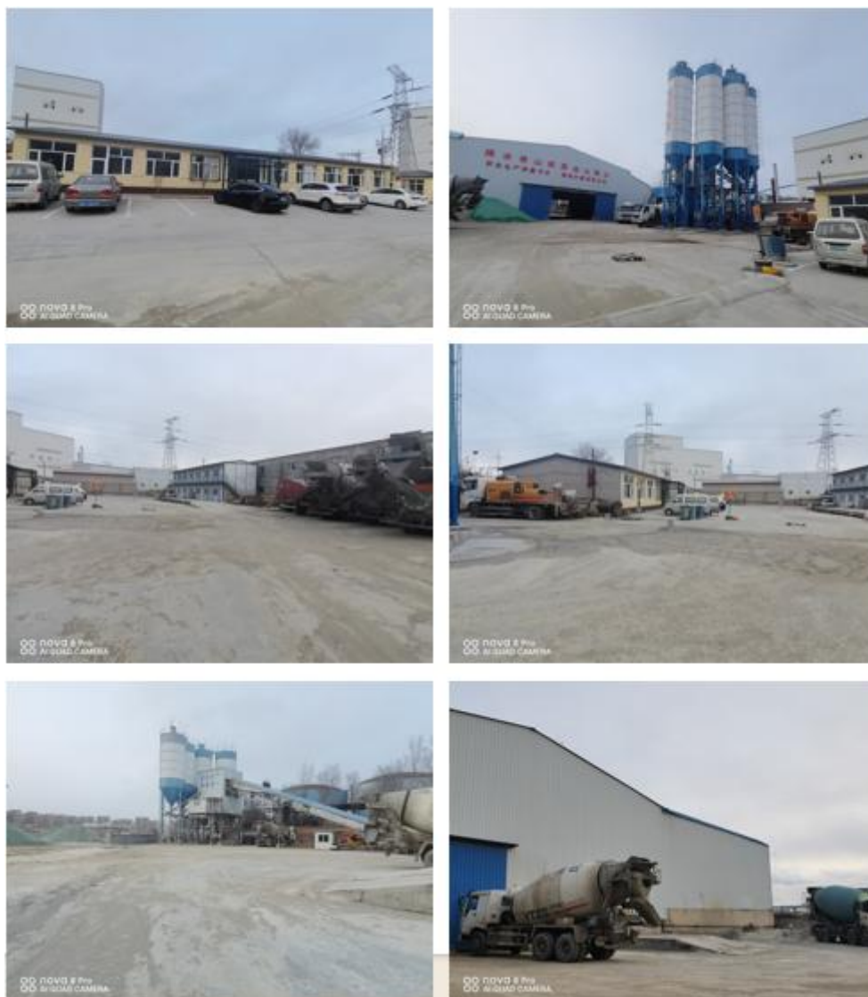
图 3-4 项目厂区现场照片