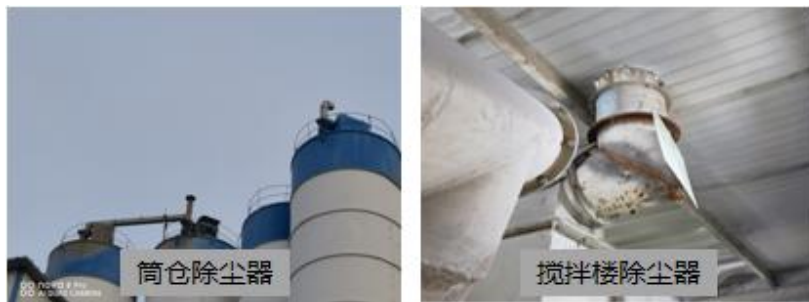
图 3-1 项目除尘设备照片

设置 1 套袋式除尘器，搅拌粉尘经袋式除尘器处理后高空外排。目前厂区除尘设备环保设施照片见下图 3-1，密闭车间及密闭输送带照片见下图 3-2。