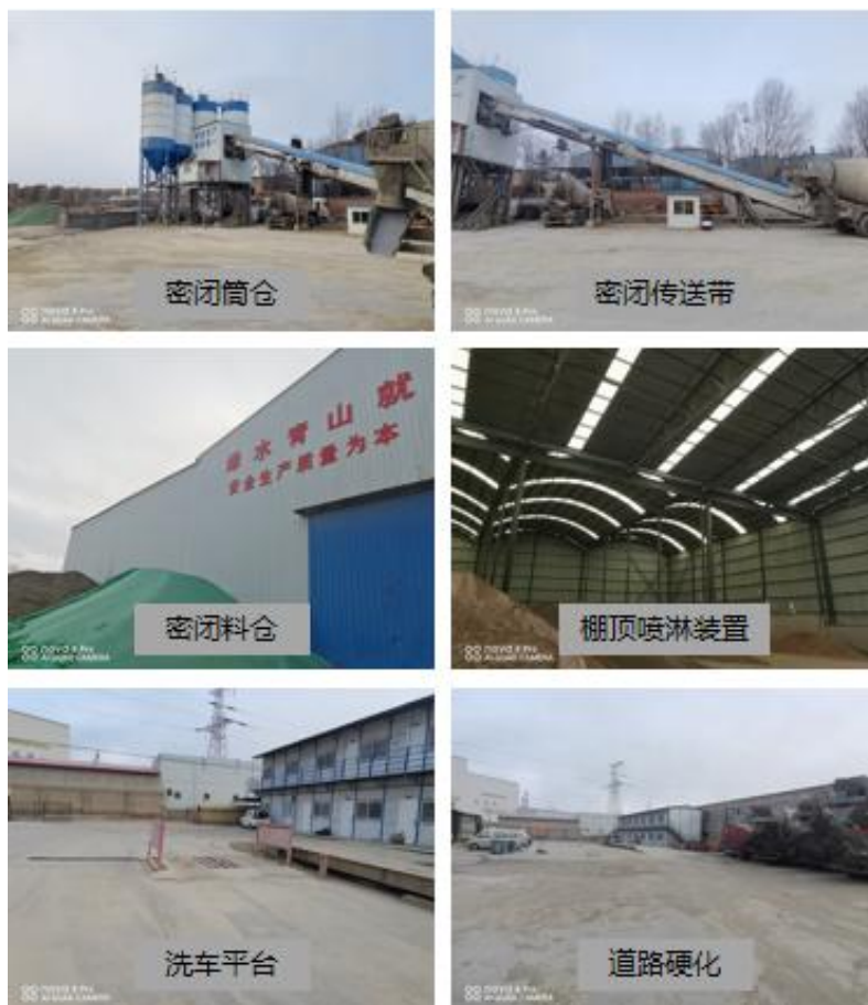
图 3-2 项目密闭车间照片